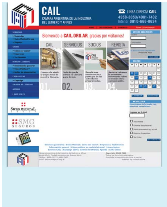
Portal de Internet de C.A.I.L. (cail.org.ar) y newsletter.