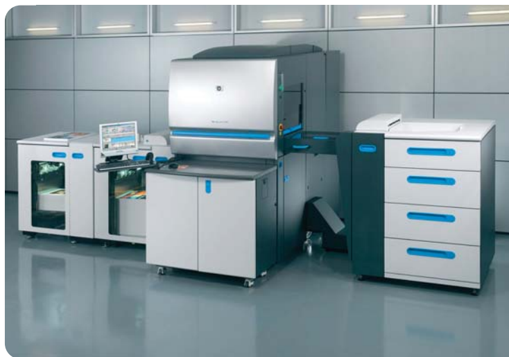
HP Indigo 5500