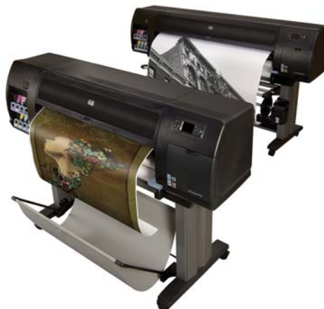
HP Designjet Z6100 Printer Series.

■ HP Designjet Z3100 Photo Printer Series: es ideal para posters, banners, mapas, presentaciones, fotos y reproducciones de obras de arte. Se destaca por brindar óptimos resultados en calidad y precisión en blanco y negro como así también en colores.