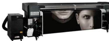
HP Designjet 10000s.

■ Designjet 10000s: está considerada la impresora de mayor rapidez en su clase. Al tener bajo nivel de solvente es excelente para aumentar la producción; y con ello la rentabilidad al incrementar el volumen de impresión y servicios reduciendo los costos.