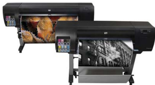
HP Designjet Z6100 Printer Series.

■ Designjet 8000s: es ideal para la producción de carteles espectaculares y letreros que requieran gran durabilidad. De operatividad sencilla y fácil manejo