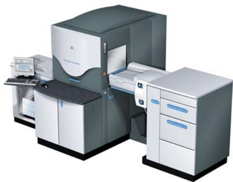
HP Indigo 3500