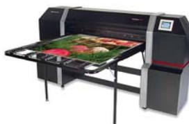
HP ColorSpan 5400uv Series.

HP es una de las empresas de mayor envergadura en el campo de TI a nivel mundial. ■