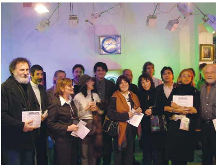
Parte de los numerosos “Artistas del Neón” que participaron de la presentación posan para Revista Letreros.

Reuniendo estas obras de numerosas artísticas en las instalaciones de Galería Centoira nos permite aproximarnos a una parte del arte contemporáneo mediante la utilización del neón, y al mismo tiempo, ver el diálogo e interrelación que sostiene en el contexto actual.