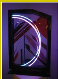
Neón, en su expresión artística.