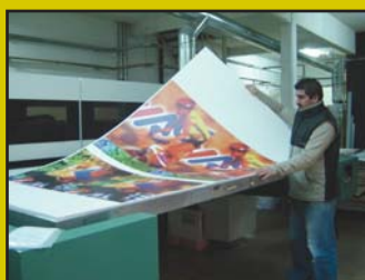
Para las Necesidades Especificas Soluciones a Medida.