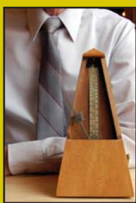
La importancia del buen uso de nuestro tiempo.