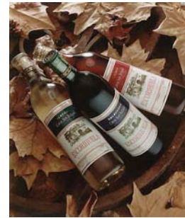
Escorihuela. Imagen de 3 botellas descansando sobre un colchón de hojas, el estudio Verdecchia realizó mil copias en 50 x 60 cms, montadas en bastidor, para restaurantes y vinerías de todo el país. Todo el trabajo y entrega lista para exhibición duró 15 días.

Osram. Desde hace muchos años, a cargo de la imagen de los diversos productos de esta marca perteneciente al grupo Siemens.