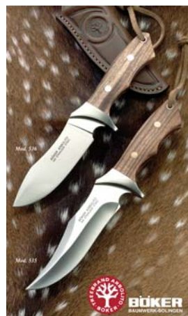
Boker Arbolito. Fotos para los diversos productos de esta empresa, que luego se utilizan en back lights, y para publicidad en medios gráficos.

Amigos de dicho Museo que se encarga de aplicar esas imágenes en afiches, láminas, libros y hasta almanaques. Al mismo tiempo, instituciones y entidades como La Feria del Sol, la Feria de los Anticuarios, y muchos decoradores que participan en la famosa Casa FOA han confiado la documentación de sus obras y eventos en nosotros. Se intenta, sobre todo cuando se trata de esculturas u obras de tipo arquitectónico especiales, de saber captar todo el espíritu, todo el encanto de las mismas, a través de ese diálogo que el profesional instala entre las luces