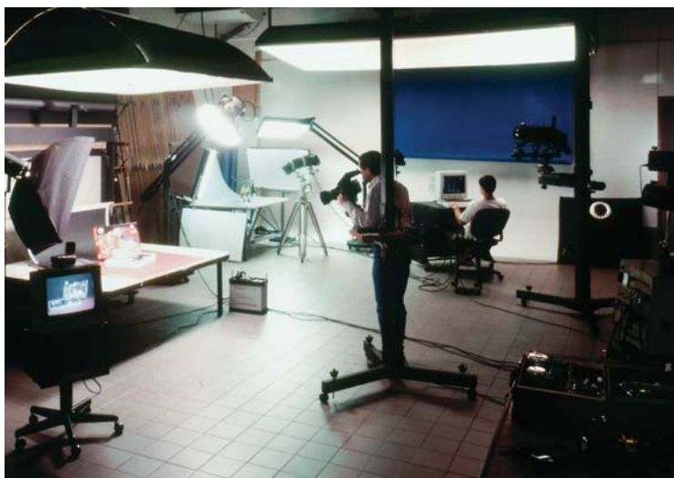
Estudio de los Verdecchia.

A mediados de los años 50, a un muchacho de 35 años que ya había recalado en varias actividades, sin encontrar muchas satisfacciones, le hizo "click" la idea de dedicarse a la fotografía profesional.