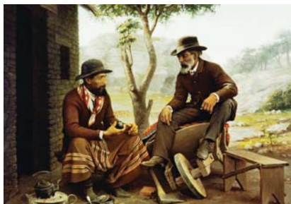
Museo Nacional de Bellas Artes de Bs. As. Aquí, dos transparencias realizadas por el estudio, para exhibición en afiches, libros y calendarios. "Esther y Mardoqueo" pintura flamenca de Aert de Gelder, y "Escena de costumbres" del argentino Genaro Pérez.