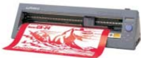
Plotter de corte de 60 cm. CX 24

NUEVA!!! VersaCAMM Roland CX Corporation