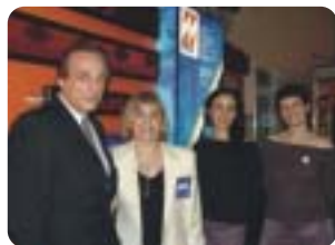
Neocolor presente en Expo Sign 2004

En estas exposiciones, la división electrónica presentó sus nuevos desarrollos: carteles doble línea, carteles de hiperbrillo y alta intensidad diseñados para la vía pública y la línea de gabinetes de aluminio en 5 colores para combinar con diferentes leds.