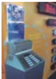
Organizador de Turnos: desarrollo Neocolor

y publicidad, presentando nuevos diseños y modelos en carteles electrónicos.