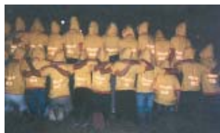
Gentileza Gráfica Rímola.