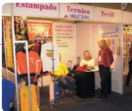
Stand de Helioday S.A. en Emitex.

Además de presentar nuestra eficaz materia prima en productos finales, se realizaron demostraciones prácticas de aplicación, exhibiendo elementos y medios conducentes a objetivos potenciales de nuevos negocios en una industria que ha vuelto a renacer”.