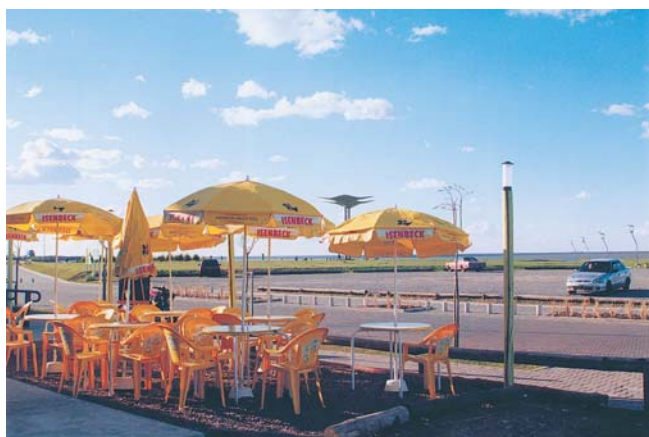
Es común su utilización en sombrillas de negocios, impresas con nombres de importantes marcas.

Existiendo lonas que tienen una garantía de 5 años o más a partir de la fecha de la instalación, con buen cuidado y limpieza, se puede esperar y sin exagerar que perduren hasta 12 años. Sí créalo, hay lonas colocadas que sobrepasan los 10 años aunque la tendencia es a perder color. Físicamente la lona puede durar mucho más, pero su estética pasará a ser desagradable a la vista con lo cual tratándose de comercios el perjuicio por mala imagen visual pasará a ser económico resintiéndose los ingresos de caja, ya que un posible cliente puede desalentarse.