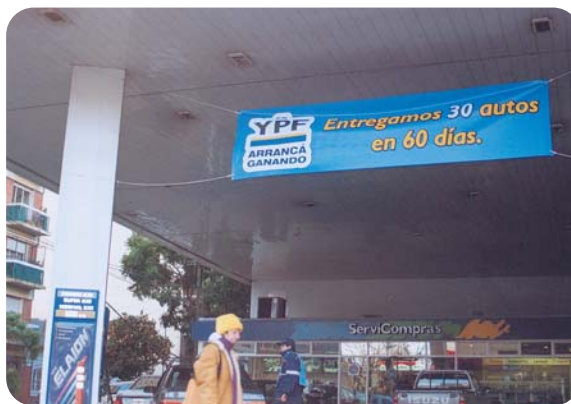
La elección de una lona en caso de promociones puntuales, deberá estar en relación directa con la duración de dicha promoción.

Si limpia la lona estando instalada, siga estos consejos paso a paso: