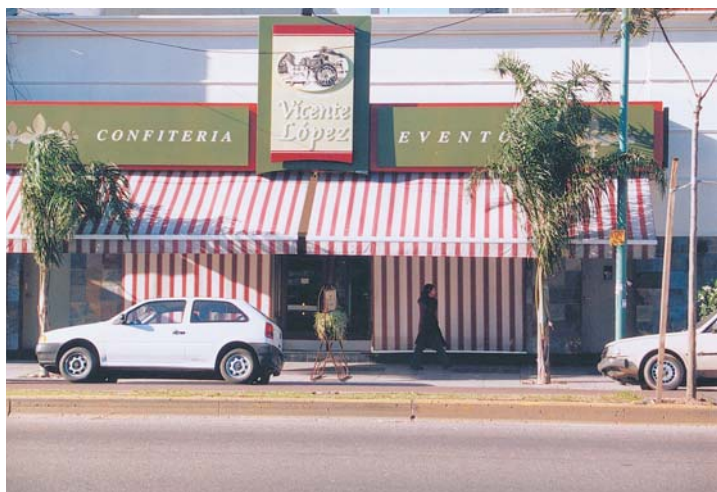
Su aspecto es importante para la imagen de un comercio y su diseño y colores deben combinar con el entorno.

Dejar que la lona se seque al aire libre. Nunca aplique calor.