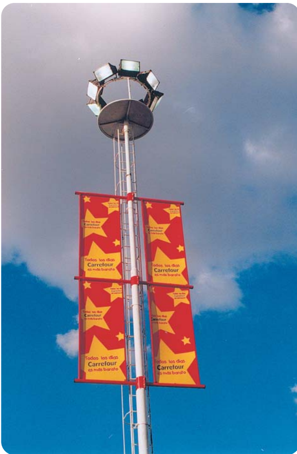
Lona plástica impresa aplicada en exteriores, en armazón metálico y tensada.