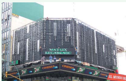
Vista del letrero de Matrix Recargado cuando se estaba en pleno proceso de armado de su estructura y colocación de los elementos de iluminación que darían lucimiento nocturno.