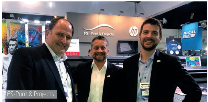
FS-Print & Projects