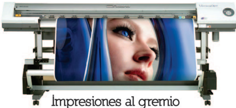
Impresiones al gremio