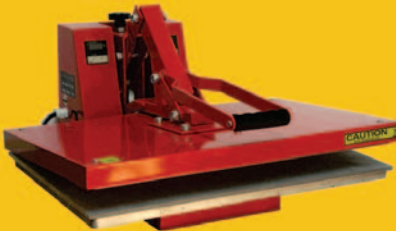
(remeras, platos, vasos y gorras)