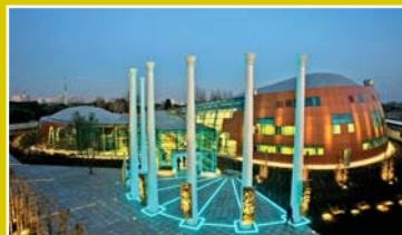
De la Música a la Arquitectura. Iluminación por lámparas de cátodo frío. (Agradecemos a ANTRON Srl)

El Centro Cultural "Mugam House" está situado en Baku, capital de Azerbaiján, y fue inaugurado en enero del 2009. Constituye una trasposición arquitectónica de una importante tradición musical azera. En esta magnífica obra se destaca la luminotecnía, constituida por lámparas de cátodo frío (neón), las columnas en color azul y circundando la construcción lámparas de cátodo frío (neón) color amarillo, cuya disposición crea la visión de que el conjunto se encuentra suspendido en el aire, desafiando a la gravedad. Ver nota en página 26 de la presente edición con más ilustraciones. Y conmemorando los 100 años del neón, las notas a partir de la pág. 70. Diseño de Tapas: Matías G. Gómez.