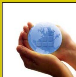
La investigación: fundamental en el segmento tecnológico. Innovación disruptiva.