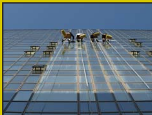
Nuevas exigencias del Seguro de Riesgos del Trabajo.