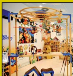
Historias de éxito: "Las ideas de Arquímedes".

Plotters Service: Distribuidor Autorizado de Bordeaux Digital Printink.